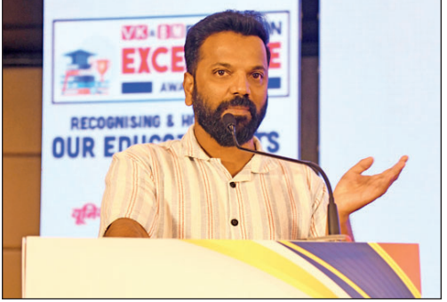
ನಟ ನೀನಾಸಂ ಸತೀಶ್ ಮಾತನಾಡಿದರು.

"ಕುವೆಂಪು ಅವರ ವಿಶ್ವ ಮಾನವ ಪರಿಕಲ್ಪನೆಯನ್ನು ಶಿಕ್ಷಣದಲ್ಲಿ ಅಳವಡಿಸಿಕೊಂಡು, ಅದನ್ನು ಮಕ್ಕಳ ಮನದಲ್ಲಿ ಬಿತ್ತುವ ಕೆಲಸ ಮಾಡಬೇಕು. ಜಗತ್ತಿನಲ್ಲಿ ಯಾರೂ ಮಲಗಲು, ಯಾರೂ ಕೆಳಗಲ್ಲ, ಶ್ರೀಮಂತರು, ಬಡವರೂ ಬೇಧವಿಲ್ಲ ಎಲ್ಲರೂ ಸಮಾನರು."