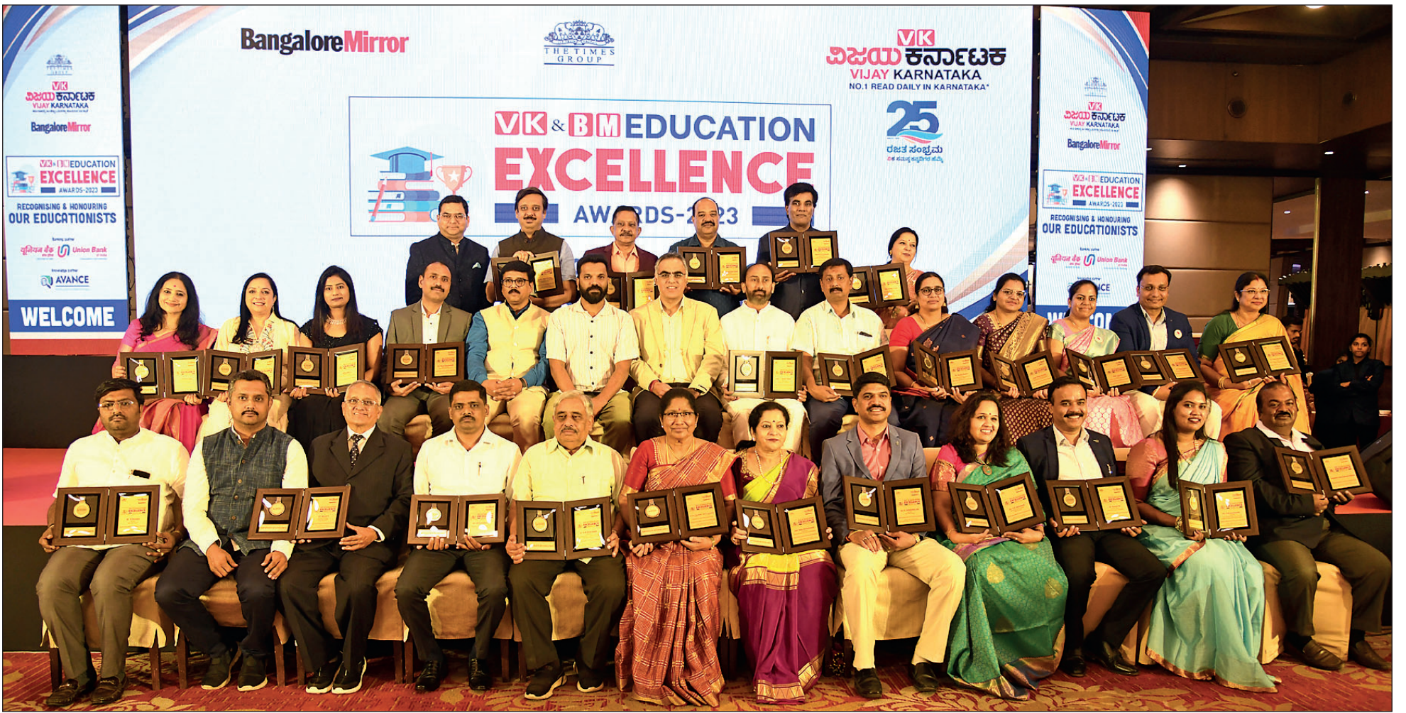
ಬೆಂಗಳೂರಿನ ಖಾಸಗಿ ಹೋಟೆಲ್‌ನಲ್ಲಿ ಆಯೋಜಿಸಿದ್ದ ಸಮಾರಂಭದಲ್ಲಿ ಸಾಧಕರಿಗೆ 'ವಿಕ-ಬಿಎಂ ಎಜುಕೇಶನ್ ಎಕ್ಸಲೆನ್ಸ್ ಆವಾರ್ಡ್ -2023' ಪ್ರದಾನ ಮಾಡಲಾಯಿತು.

ವಿಶ್ವದಲ್ಲಿ ಮಾನವ ಧರ್ಮ ಬಿಟ್ಟು ಬೇರೆ ಯಾವ ಧರ್ಮವಿಲ್ಲ. ನಾವೆಲ್ಲರೂ ಒಂದಾಗಿದ್ದು, ಒಗ್ಗಟ್ಟಿನಿಂದ ಬದುಕು ಸಾಗಿಸೋಣ ಎನ್ನುವ ಅರಿವು ಜ್ಞಾನ ಮಕ್ಕಳಿಗೆ ನೀಡುವುದು ಇಂದಿನ ತುರ್ತು ಆಗುತ್ತವೆ," ಎಂದು ತಿಳಿಸಿದರು.