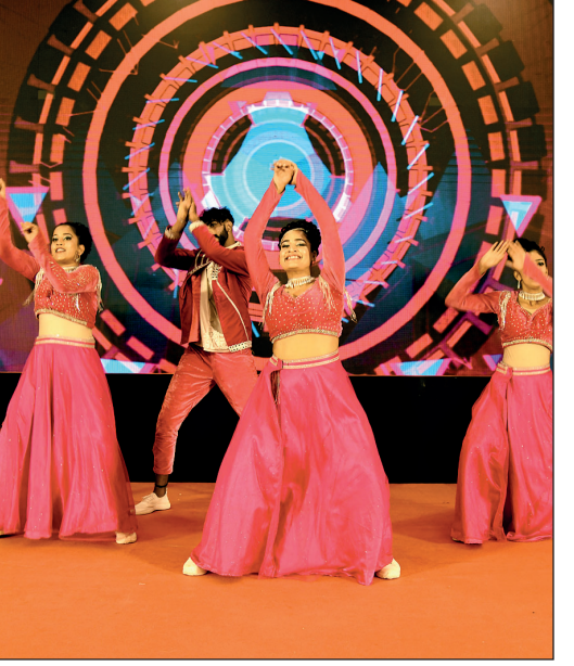
ಸಾಂಸ್ಕೃತಿಕ ಕಾರ್ಯಕ್ರಮಗಳ ಮರುಗು.